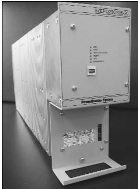
1. ábra: SZEPEQ 230/336-15/20 1

rendszerbe illesztett SZEPEQ modulok 220 V, illetve 110 V névleges kimeneti feszültségűek, létezik 40 A-es kimenő áramú változat is (1. ábra).